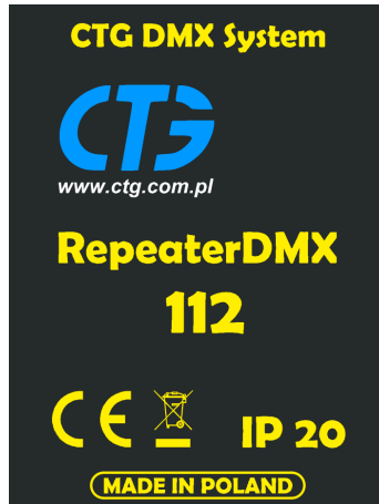
Rysunek 1: Widok panelu urządzenia